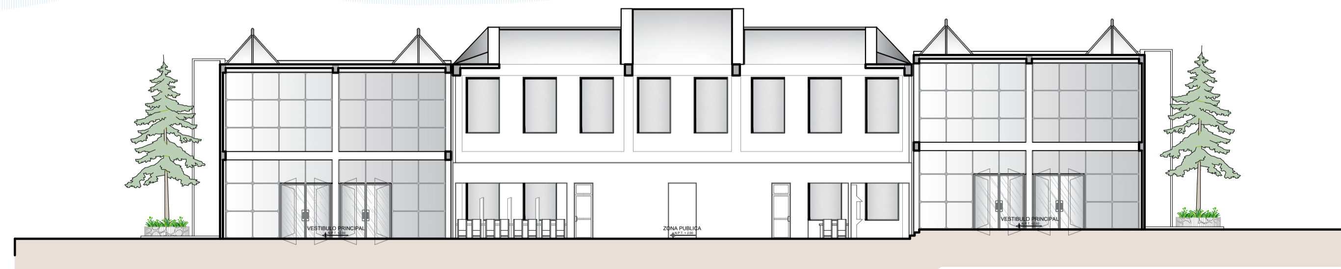
CONJUNTO CORTE D-D