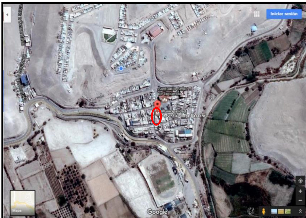
Figure 2 Mapa de Ubicación de la Provincia Jorge Basadre