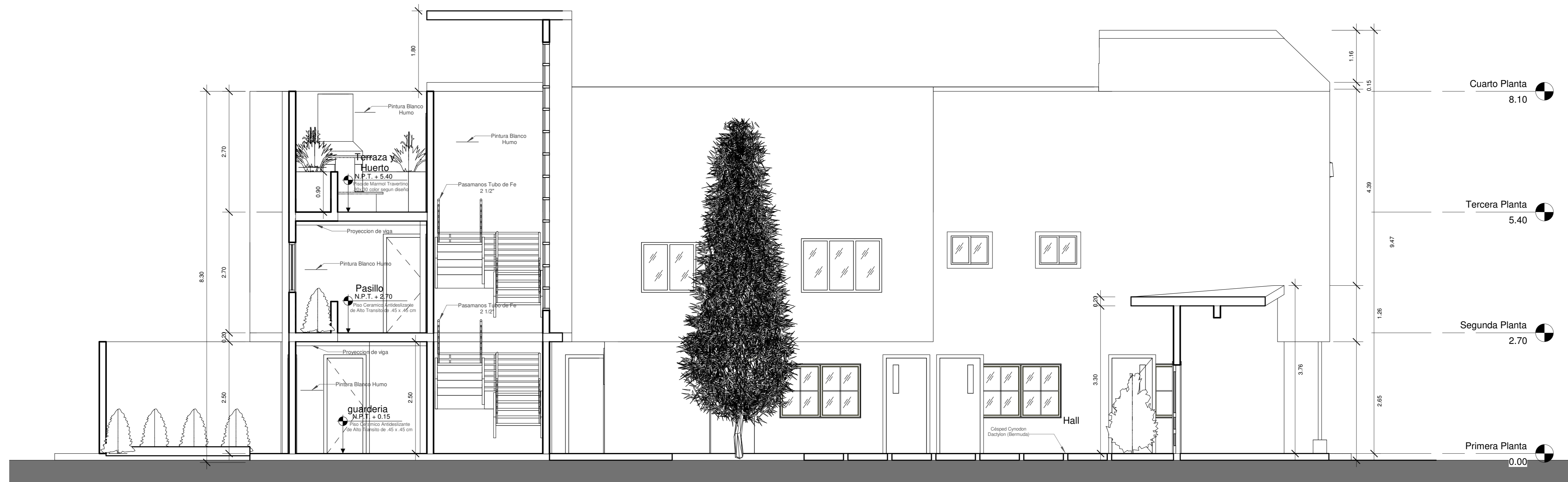
PROPUESTA: CORTE 3 - 3 "Centro de Atención y Refugio Temporal Para las Víctimas de Violencia Familiar" Escala: 1/50