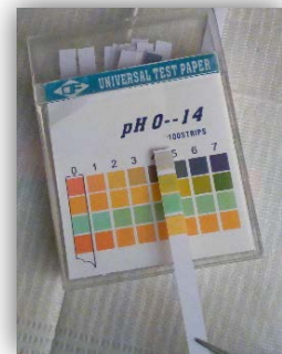
PRUEBA CON CINTAS REACTIVAS