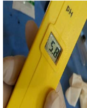
RESULTADOS DE LOS VALORES DEL PH SALIVAL CON EL PH-METRO