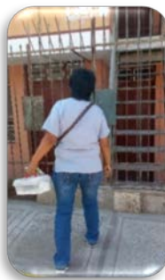
RELACION DE PACIENTES DEL PROGRAMA DE DIABETES DEL DPTO DE ENDOCRINOLOGÍA DEL CS LA ESPERANZA