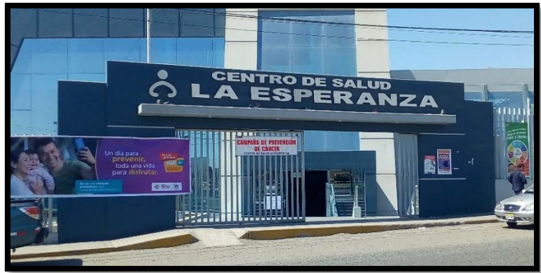
CS LA ESPERANZA DEL DISTRITO ALTO DE LA ALIANZA DE LA CIUDAD DE TACNA