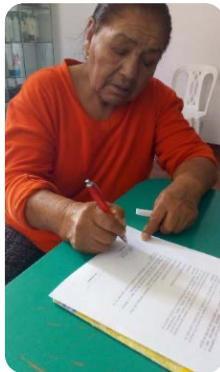
FIRMA DEL CONSENTIMIENTO