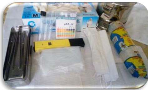
MATERIALES PARA EL ESTUDIO