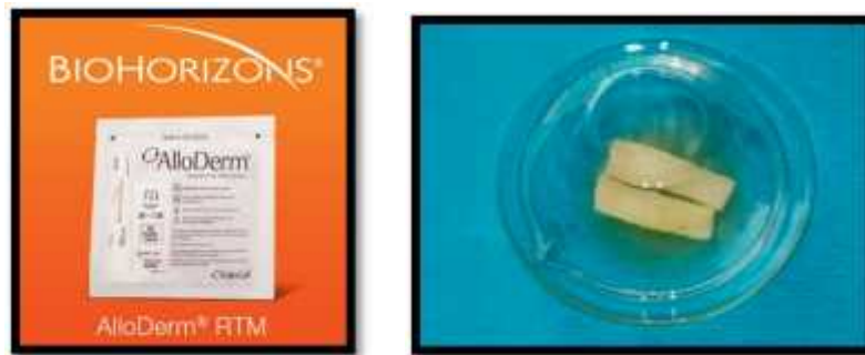
Fig. 3 www.biohorizons.com/alloderm.aspx

Entre sus desventajas, la poca predictibilidad en la ganancia de encía queratinizada, la poca evidencia de estabilidad a largo plazo, su contraindicación en pacientes alérgicos a ciertos antibióticos, y una técnica quirúrgica laboriosa. 6