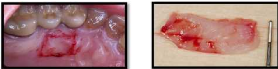
Fig.1 Injerto libre de encía